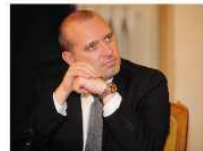
Presidente della Regione Emilia Romagna Stefano Bonaccini

La scelta della Regione illustrata ieri dal presidente Stefano Bonaccini: «Stop ai privilegi»