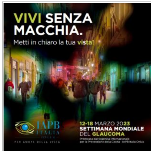
Un manifesto realizzato da IAPB Italia per l'imminente Settimana Mondiale del Glaucoma